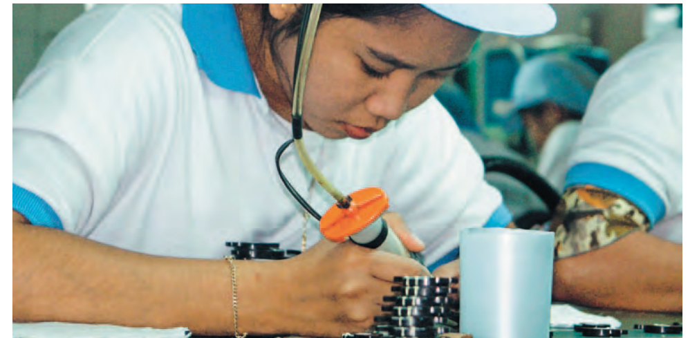
Industrie électronique: l'Etat est un acheteur important qui peut influencer les acteurs économiques

à mettre plus d'éthique dans les circuits. Enfin, dans les usines de deux fournisseurs de Hewlett Packard en Chine, des ONG indépendantes ont récemment pu réaliser des programmes de formations des ouvriers à leurs droits. Ces efforts demeurent cependant insuffisants. En effet, au-delà des codes et des tables rondes de discussion, la majorité des entreprises électroniques demeurent hermétiques aux processus conventionnels de négociation collective, et refusent de collaborer activement avec les ouvriers/ères, syndicats et organisations non-gouvernementales des pays de production. Résultat: dans les pays où sont assemblés nos ordinateurs, la plupart des employés/es ignorent toujours leurs droits. Ils n'ont jamais été informés/es des dispositions de la législation nationale ou internationale du travail, ni même du code de l'entreprise. Dans ce contexte, tous les audits externes, les recommandations et les sanctions n'auront qu'un impact limité, voire nul, sur la réalité des conditions de travail dans les usines de l'électronique.