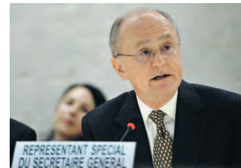
John Ruggie, représentant spécial de l'ONU: des règles pour les sociétés transnationales et autres entreprises

Le rejet des normes de l'ONU par la Commission des droits de l'homme a constitué un revers cuisant pour le développement du respect des droits de l'homme. La Commission n'a cependant pas abandonné la question, mais exigé – dans une résolution en 2005 –