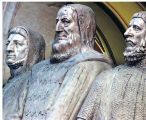
Liberté et justice: le vœu des confédérés est devenu aujourd'hui une nécessité globale.

Ces missions peuvent s'avérer contradictoires, car la défense des intérêts économiques de la Suisse et la promotion des droits humains ne vont pas toujours de pair.