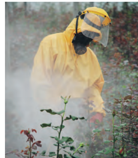
Culture de roses: la protection de la santé des travailleurs – un droit fondamental

Les activités des divers offices fédéraux en matière d'économie et de droits humains n'ont jusqu'ici été que ponctuelles, sans aucune vision à long terme. Le gouvernement suisse devrait agir de manière beaucoup plus systématique, afin de renforcer la conscience de l'économie en matière de droits humains. Il s'agit notamment d'informer régulièrement les entreprises, mais aussi de créer un institut national des droits de l'homme. Ce dernier permettrait d'offrir un soutien concret et indépendant aux multinationales et aux PME suisses, à l'exemple du Danish Institute on Human Rights.