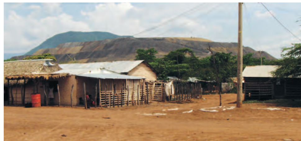
Exploitation de charbon en Colombie: des villages déplacés et la tentative d'obtenir justice par les procédures de plainte l'OCDE

Lors de la première et jusqu'ici unique rencontre entre tous les acteurs impliqués, les sièges des entreprises concernées ont proposé