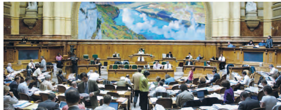
Salle du Parlement à Berne: la balance symbolise l'indépendance de la Suisse, mais concrètement reflète la pesée entre des intérêts contradictoires

Toutefois, le Conseil fédéral demeure prudent: «de nombreux acteurs économiques n'intégreront cet impératif dans leurs décisions que si cela n'érode en rien leur compétitivité. 3 » Aux yeux des autorités, le respect des droits humains ne doit pas devenir un désavantage concurrentiel pour les entre-