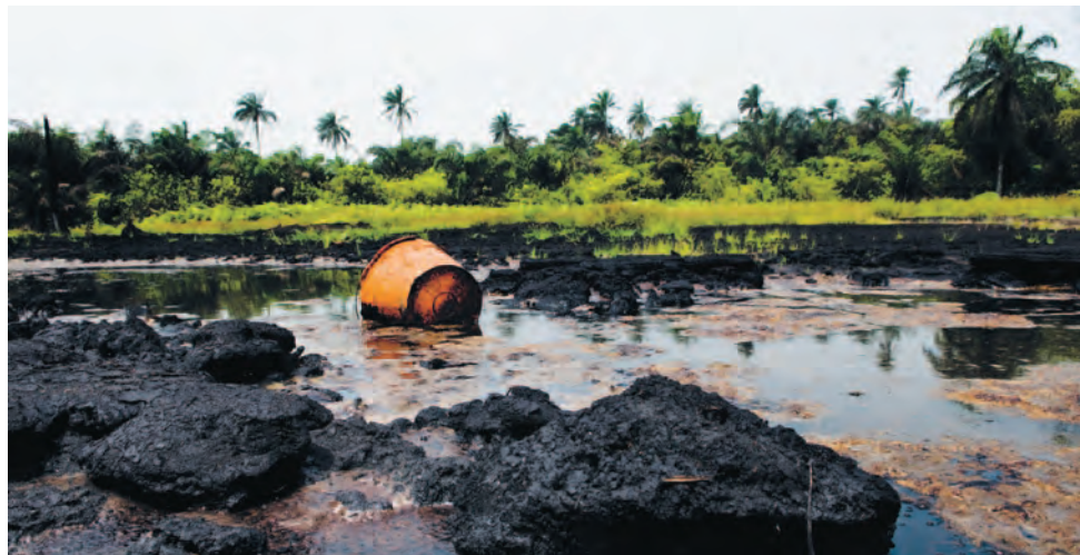
Exploitation pétrolière dans le Delta du Niger: des profits pour Shell et pour les potentats locaux – du poison pour la population

Les dégâts sont souvent causés par un mau- vais entretien des infrastructures, comme par exemple la corrosion des oléoducs. Ils ne sont pas uniquement dus, comme le prétend Shell, à des actes de vandalisme, de vol de pétrole ou de sabotage.