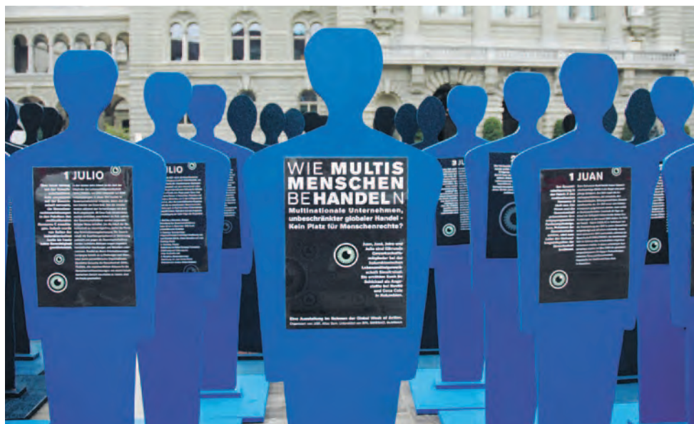
Exposition sur la place fédérale: donner une voix à tous ceux qui ne peuvent faire reconnaître leurs droits dans leur pays.

Initié en 1999 par Kofi Annan, alors secrétaire général des Nations-Unies, le Global Compact est une initiative qui encourage les entreprises à «aligner leurs opérations et leurs stratégies sur dix principes universellement acceptés touchant les droits de l'homme, les normes du travail, l'environnement et la