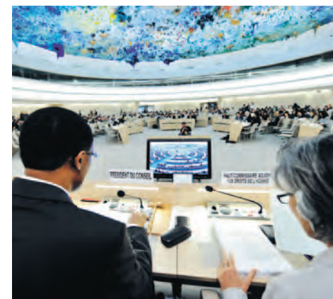
Conseil des droits de l'homme à Genève: lentement, mais sûrement il renforce la responsabilité sociale des entreprises.

Le processus Ruggie exige de revoir les mesures actuelles, de reconnaître les lacunes et de créer des instruments contraignants, afin de renforcer les engagements de l'économie en matière de droits de l'homme.