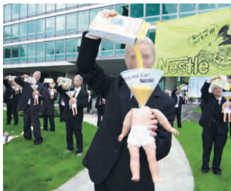
Action contre les aliments pour bébé de Nestlé: les ONG sont des vecteurs d'informations sur les droits humains

rement dénoncé par des campagnes les pratiques des multinationales contraires aux droits de l'homme – par exemple, la commercialisation agressive d'aliments pour bébé de Nestlé. Parallèlement, divers processus politiques ont eu lieu au plan international afin de rendre l'économie plus responsable. Il convient ici de mentionner en particulier la tentative d'adopter des normes contraignantes pour les entreprises privées dans le cadre de l'ONU 2 .