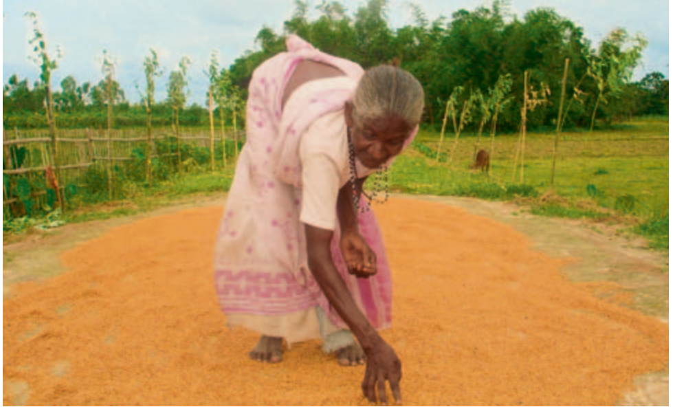
La production alimentaire est la responsabilité des femmes, Bangladesh 2007.

Romana Büchel, responsable des questions de genre, Action de Carême