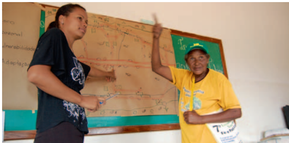
Jeunes et aînées présentent leur carte des risques au groupe des femmes, Brésil 2011.

Un certain nombre des participantes aux discussions animées avaient emmené leurs bébés ou leurs petits enfants. Voilà aussi une différence par rapport aux journées des hommes. Les plus grands jouent à portée de voix, les bébés passent de bras en bras. Pourtant, les femmes font preuve de concentration dans leur travail. Il ressort des discussions que les femmes de Tapera sont fortes et indépendantes, qu'elles participent et donnent leur opinion, qu'un grand nombre d'entre elles assument des responsabilités sociales et des fonctions de direction au sein de la communauté. Le seul domaine qu'elles considèrent comme exclusivement masculin est l'élevage de bétail. Pour Marion Künzler, experte en climat de