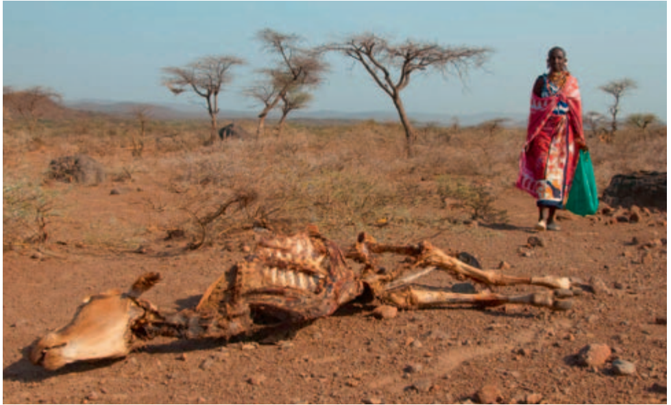
Ravages du changement climatique: femme massai avec le cadavre d'un animal, Kenya 2009.