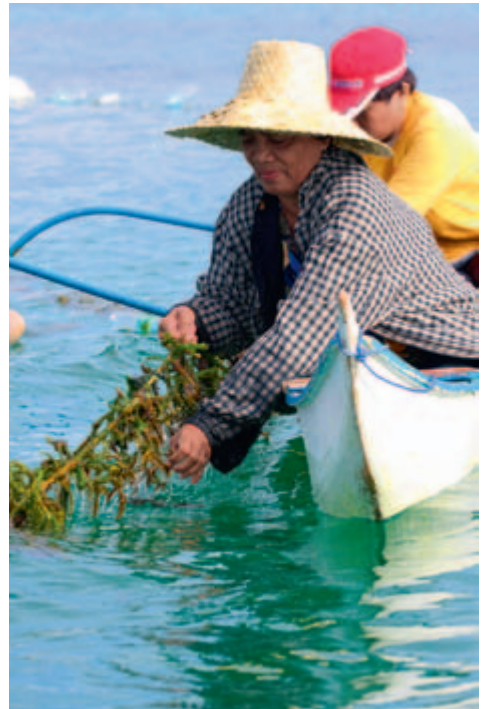
La pêche aux algues : une source de revenus importante, Philippines 2011.

Lors d'une analyse de risques de catastrophes climatiques menée ensemble avec Pain pour le prochain , les pêcheurs et les pêcheuses