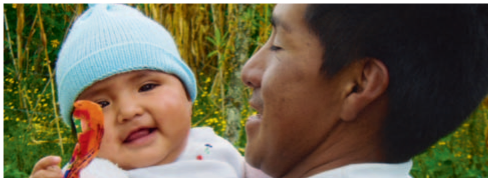
Travail de soins: les hommes, eux aussi, doivent mettre la main à la pâte, Colombie 2008.

travail accompli par les femmes dans l'économie de subsistance ou dans le secteur informel, dans lesquels la maximisation des profits n'existe pas? Quelles sont les conséquences sur la qualité de vie et la situation alimentaire des femmes et de leurs familles de leur intégration au marché capitaliste? Que retirent-elles de leur participation au marché lorsqu'elles deviennent un maillon de la chaîne de valeur? Autant de questions auxquelles nous devons trouver des réponses.