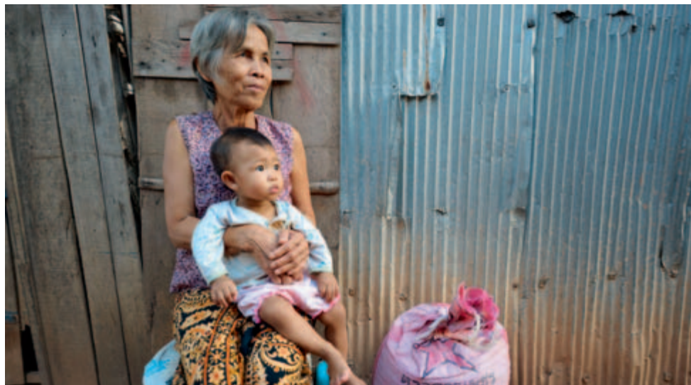
Une grand-mère garde son petit-enfant, Cambodge 2009.