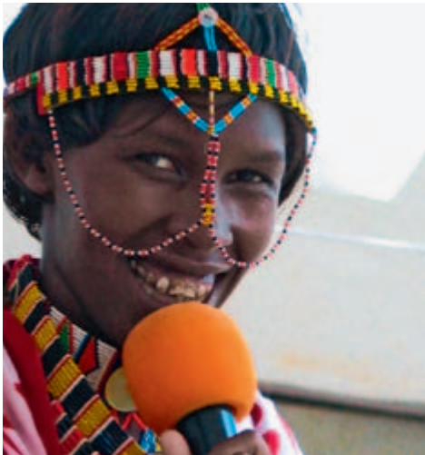
Femme massaï au Forum social mondial, Dakar 2011

Aux niveaux de la gouvernance et de la politique , il s'agit de négocier des règles du jeu équitables pour les deux sexes et garantissant la participation politique des hommes et des femmes sur un pied d'égalité. D'une part, les questions de genre doivent être intégrées systématiquement aux négociations lors des conférences climatiques. D'autre part, il s'agit aussi de faire participer les femmes à la définition des mesures à prendre dans le cadre de la politique de protection du climat. L'égalité face aux politiques alimentaire et climatique est indispensable aux niveaux local, national et international. A cet égard, il est essentiel d'analyser séparément les conséquences pour les femmes et pour les hommes. C'est la seule manière de prendre des mesures différenciées permettant d'abolir les inégalités au lieu de les exacerber. Le Sommet de la terre Rio+20 (voir pp. 4–8 et 13–17) offre cette possibilité. Si on se contente d'opérer des changements structurels dans les politiques d'investissement ou de l'emploi, comme c'est le cas dans le cadre du changement climatique, le risque de créer de nouvelles formes de discrimination de genre est élevé. Il est donc déterminant pour le succès de la Conférence de suivi Rio+20 que les concepts de l'économie verte et leur mise en œuvre soient utiles pour les deux sexes à parts