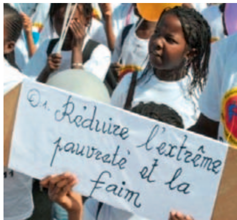
Femmes au Forum social mondial à Dakar, 2011

Un modèle d'économie verte véritablement durable et équitable sur le plan social doit donc associer une solide politique climatique au droit au développement – comme cela est prévu par l'approche des Droits au développement dans un monde sous contrainte carbone (Greenhouse Development Rights). Cette approche est basée sur le principe d'un droit d'émission par personne – indépendamment de l'origine et du sexe. Une telle justice climatique permet de concilier de manière équitable les intérêts de toutes les popula-