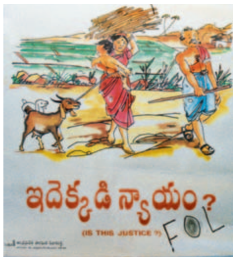
Campagne indienne sur le genre

Si ces femmes avaient le même accès aux moyens de production que les hommes, elles pourraient augmenter les récoltes de leurs champs de 20 à 30 pour cent. Cela permettrait d'accroître jusqu'à 4 pour cent les récoltes agricoles de ces pays, et de réduire de 12 à 17 pour cent le nombre de personnes victimes de la faim dans le monde.