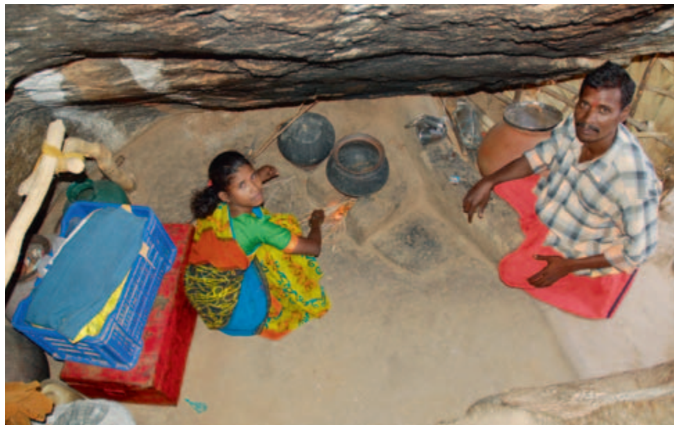
Le strict nécessaire au Sud : un couple cuisine en Inde, 2006.