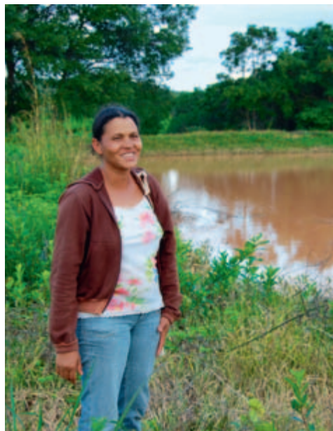
Les bassins de rétention d'eau compensent les précipitations irrégulières, Brésil 2011.