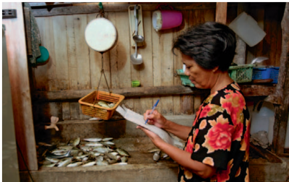
La vente commune des produits de la pêche améliore la sécurité des revenus, Philippines 2011.

La mort des récifs et la multiplication des événements El-Niño (courants marins chauds) réduisent les rendements de la pêche. Les régions côtières dans lesquelles les femmes et les enfants ramassent des coquillages sont toujours plus souvent inondées. Les prairies sous-marines et les mangroves, qui servent de source d'alimentation et de revenus pour les femmes, sont de plus en plus détruites par les catastrophes climatiques, l'érosion et de nouvelles utilisations. La pauvreté augmente et la faim sévit, en particulier auprès des femmes et des enfants. En raison de la surexploitation des ressources, de nombreuses femmes doivent travailler loin de leur foyer et de leur famille afin de contribuer au revenu familial.