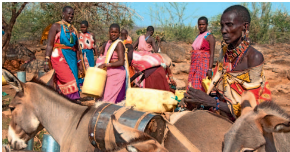
Femmes massai en quête d'eau, Kenya 2009.